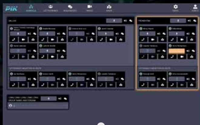
Konsola - komunikat PIMa do grupy